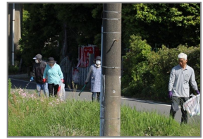
▲今回回収されたゴミ(左)と大船津第三区の様子(右)