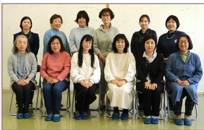
(写真上)講師のアドバイスを受けながら、手元の作業に集中 (写真下)できあがった作品を着装してハイポーズ!

豊津では初めての開催となりますが、他の公民館では人気のある事業です。ぜひ、多くの方のご参加をお待ちしています。