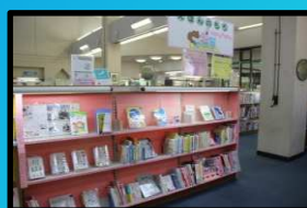
ママ・パパ応援bookコーナー