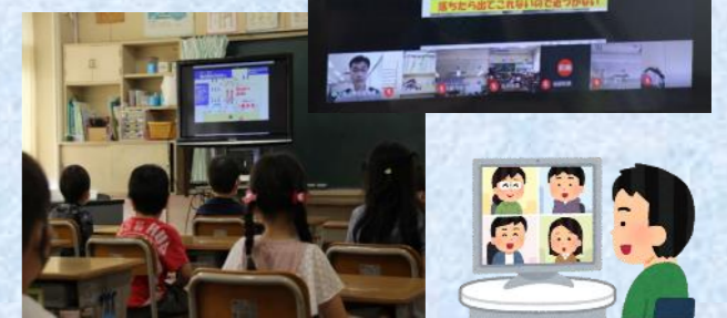
オンラインによるクラスの様子↓