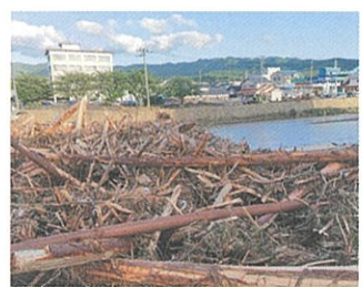
令和6年能登半島大雨災害(輪島市)