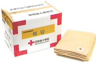
被災者配布用毛布 1人分