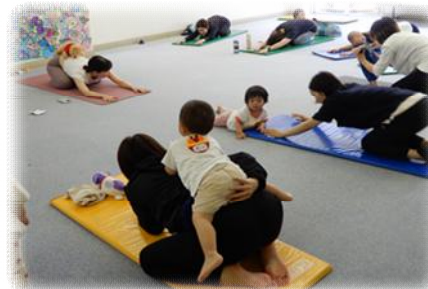
親子で楽しむヨガ♪