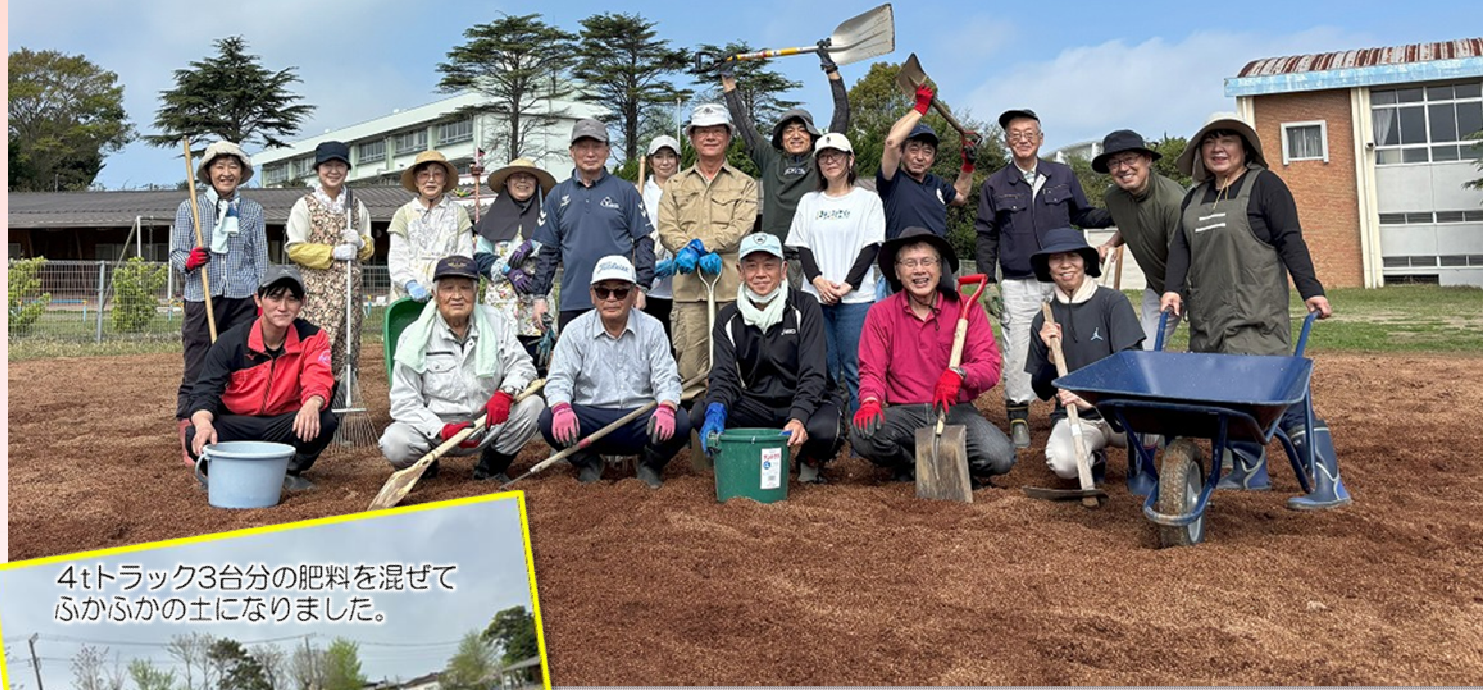
4tトラック3台分の肥料を混ぜて ふかふかの土になりました。