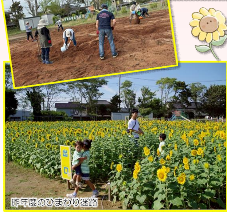
昨年度のひまわり迷路