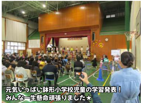
元気いっぱい鉢形小学校児童の学習発表！ みんな一生懸命頑張りました★