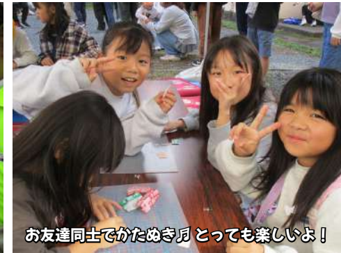
お友達同士でかためき肩とっても楽しいよ！