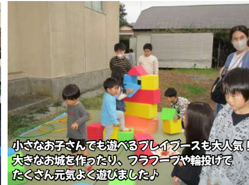
小さなお子さんでも遊べるプレイスペースも大人気！ 大きなお城を作ったり、フラフープや輪投げで たくさん元気に遊びました♪