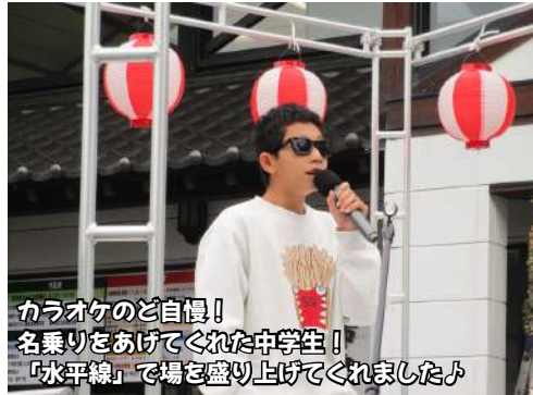
カラオケのど自慢！ 名乗りをあげてくれた中学生！ 「水平線」で場を盛り上げてくれました♪