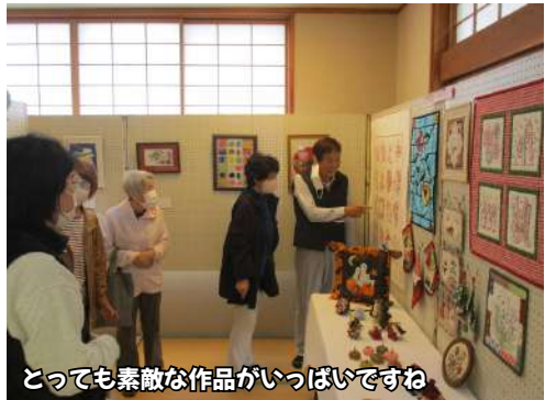
とっても素敵な作品がいっぱいですね