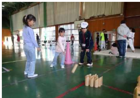
▲モルック・転び方教室 輪投げやボッチャもありました！