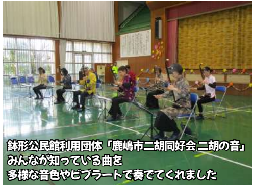
鉢形公民館利用団体「鹿嶋市二胡同好会 二胡の音」 みんなが知っている曲を 多様な音色やビブラートで奏でてくれました