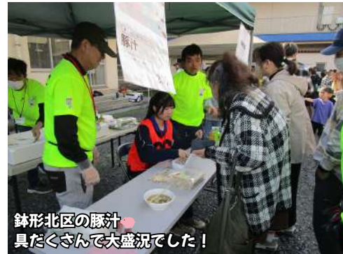
鉢形北区の豚汁 具たくさんで大盛況でした！