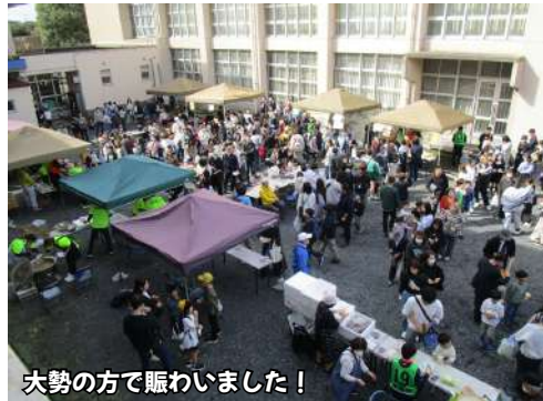
大勢の方で賑わいました！