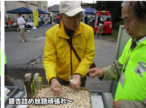
銀杏詰め放題頑張れ～