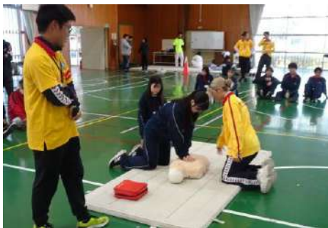
▲ライフセーバーによる救命講習

鹿とマジ勝負⚡！大人も子どもも本気になって『鹿とフリースロー対決』や『鹿鬼ごっこ』など、色々な種目を楽しみました。