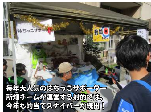
毎年大人気のはちっこサポーター 所煙チームが運営する射的では、 今年も的当てスナイパーが続出！