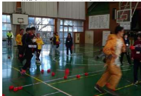
▲走り回る鹿を追いかけて背中の かごに球を入れろ「鹿鬼ごっこ」