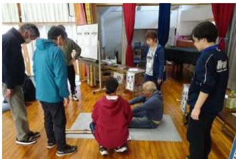
▲久しぶりに身体測定中 体が昔よりかたくなったな～