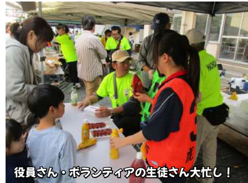
役員さん・ボランティアの生徒さん大忙し！