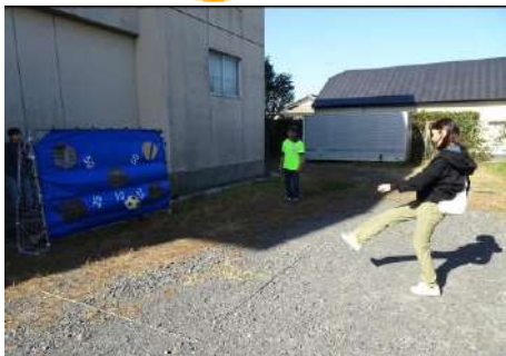
▲狙いを定めてシュート🏐 キックターゲット！