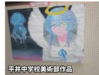
平井中学校美術部作品