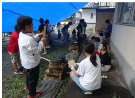
▲飯盒でご飯炊いてます！

子どもたちの協調性・自己肯定感・自立や主体性の心などを育むことを目的にはちっこキャンプが開催されました。