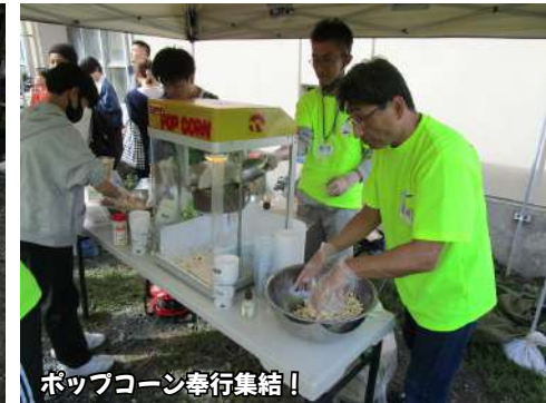
ポップコーン奉行集結！