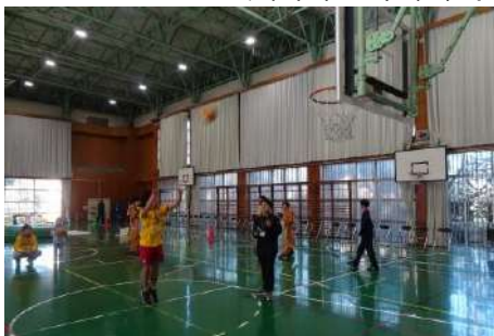
▲全6チーム出場 「鹿とフリースロー」対決🏀