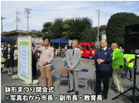
鉢形まつり開会式 ※写真右から市長・副市長・教育長