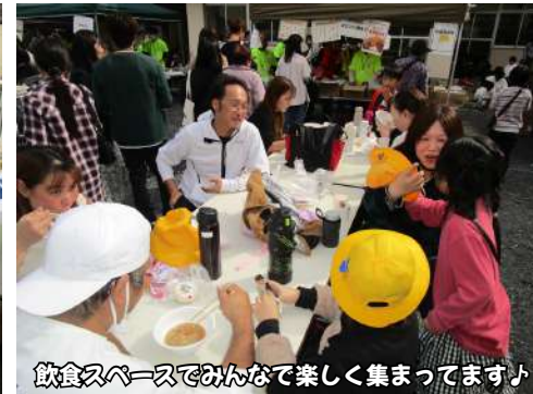
飲食スペースでみんな楽しく集ってます♪