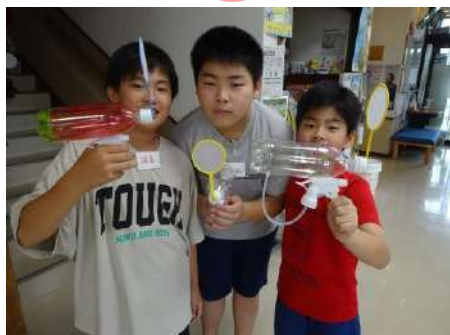
▲自分で作った水鉄砲！