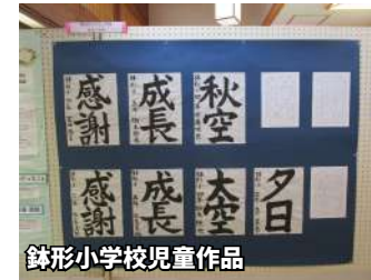
鉢形小学校児童作品