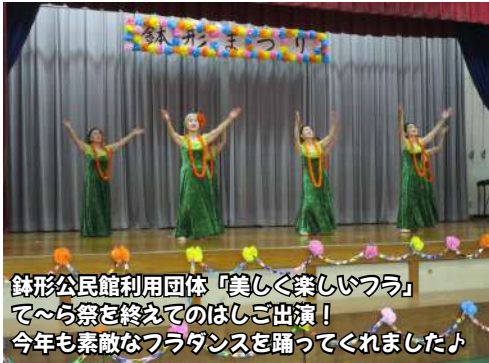
鉢形公民館利用団体「美しく楽しいフラ」 で～ら祭を終えてのはしご出演！ 今年も素敵なフラダンスを踊ってくれました♪