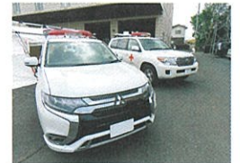
茨城県支部救護車両 プラグインハイブリッド車(手前)