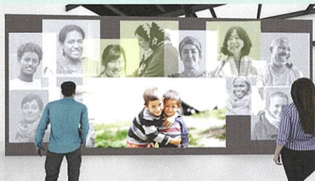
赤十字パビリオン Zone1のイメージ