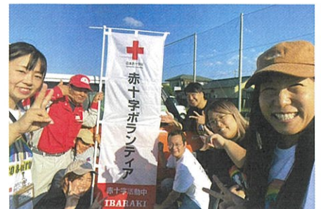
赤十字Eco&Cross奉仕団のみなさま

私たちは、2007年に中央地区青年赤十字奉仕団から始まり、現在は特殊奉仕団として活動しています。「各々が自分の場所で出来ること」を探求し、「陰の力」となって活動することを目標にしています。エコキャップ活動は、気軽に実行できる小さな奉仕ですが、協働することで「世界の子どもにワクチンを提供する」という大きな成果を挙げることが出来ます。コロナ禍を経た今、改めて「赤十字奉仕団員の信条」を胸に、身近な奉仕を広げていきます。