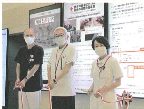
デジタルサイネージ披露会でのテープカット (左から副院長・院長・看護部長)