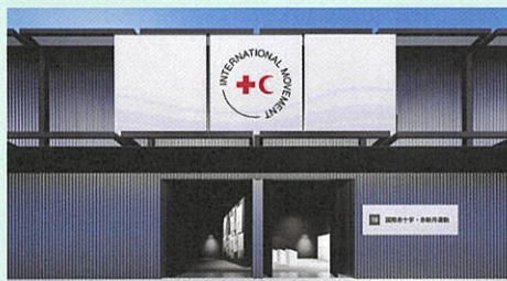
赤十字パビリオン 外観イメージ