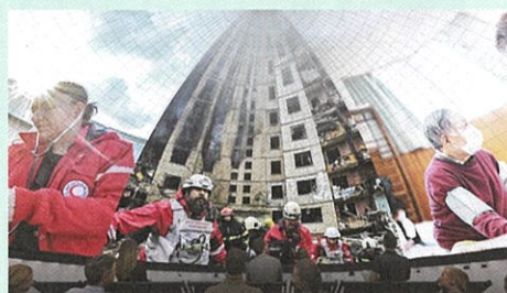
赤十字パビリオン Zone2のイメージ

2025年4月13日（日）から10月13日（月）までの184日間にわたり、大阪 夢洲を会場に大阪・関西万博が開催されます。赤十字は「国際赤十字・赤新月運動館」として国連などの国際機関と同じ区画にパビリオンを出展します。「人間を救うのは、人間だ。～ The Power of Humanity～」をコンセプトに、世界の人道危機、そこに立ち向かい、立ち上がる人々のヒューマンストーリーを通して赤十字の使命と人間のチカラを感じるパビリオンです。