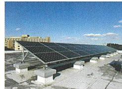
茨城県赤十字血液センター 太陽光発電システム