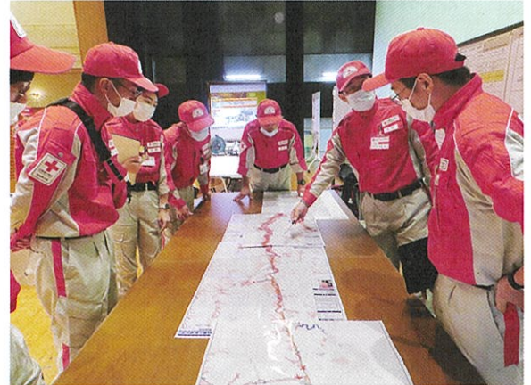
地図上で避難所周辺情報を共有する職員

当支部では今後も、各関係機関と連携しながら訓練を実施するとともに、防災セミナーや救急法等講習を実施し、地域の災害対応力の向上に貢献してまいります。