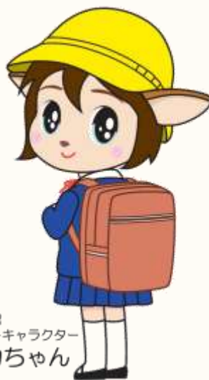
鹿嶋市公認 マスコットキャラクター ナスカちゃん