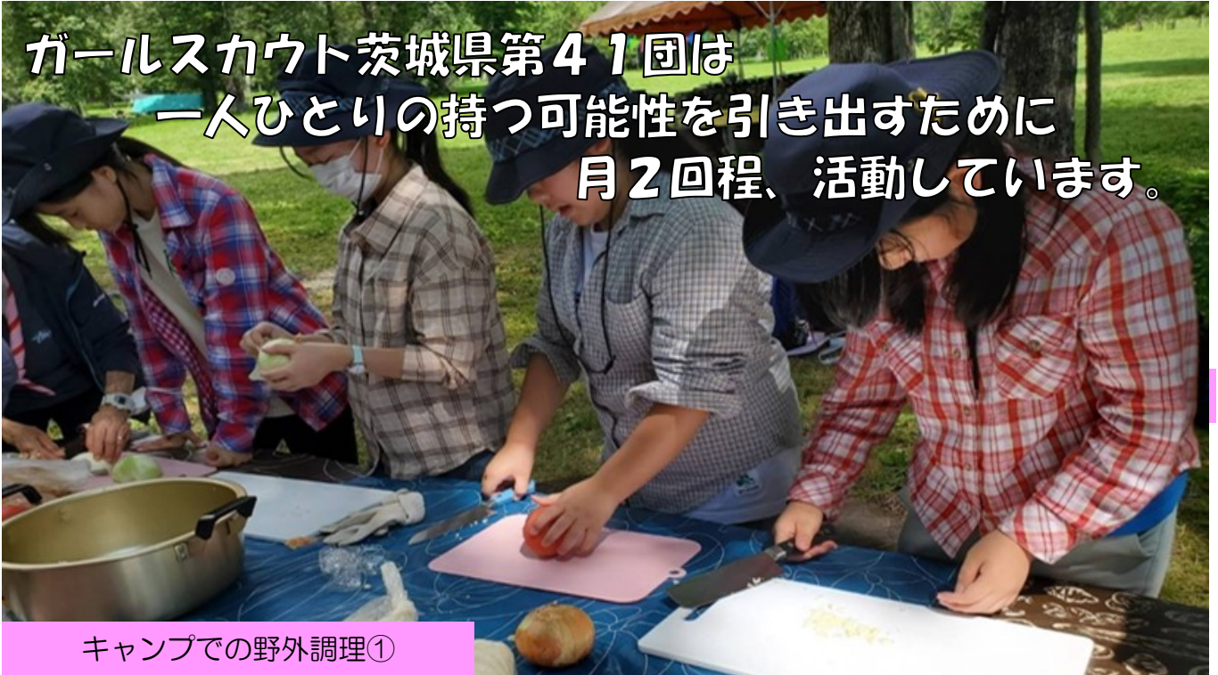
キャンプでの野外調理①

ガールスカウト茨城県第41団は 一人ひとりの持つ可能性を引き出すために 月2回程、活動しています。