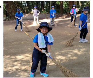
鹿島神宮清掃奉仕

【問合せ先】 ガールスカウト茨城県第41団MAIL gs.ibaraki041@gmail.com