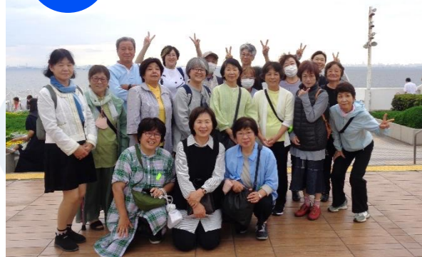
横須賀ウォーキング 38人

横須賀軍港めぐりとバラ園を見学しました。港の周りにはバラ園があり、満開のバラが咲いてお散歩やウォーキングコースとしてもぴったりでした。横須賀ウォーキングは晴天のなか三溪園を自由にウォーキング、浜風が気持ち良かったです。