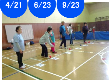
軽スポーツ 26人・20人・15人

ポッチャは誰もが楽しめるパラリンピックの正式種目です。ルールも簡単で、老若男女問わず参加できます。今大会は21チームの参加があり、各チーム7ブロックに分かれてリーグ戦が行われました。