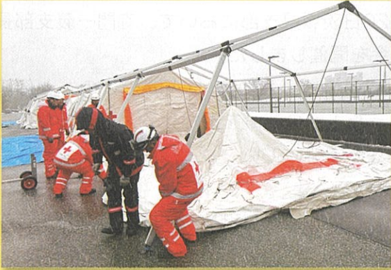
医療救護班等の生活拠点としてテント設営 (珠洲市内運動公園)