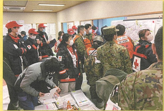
医療救護班に対し活動方針を指示 (珠洲市 健康増進センター)

茨城県支部では1月5日から支部職員2名を石川県珠洲市に派遣。情報収集にあたり、医療救護班の生活拠点の設営を実施。