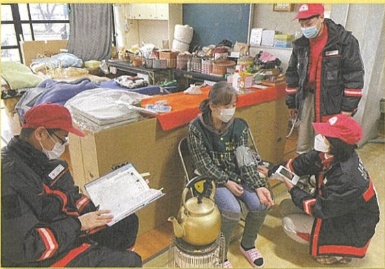
避難所の巡回診療 (珠洲市内各所)

水戸赤十字病院・古河赤十字病院の医師・看護師により医療ニーズを集約し、珠洲市の医療救護班活動をコントロールしました。