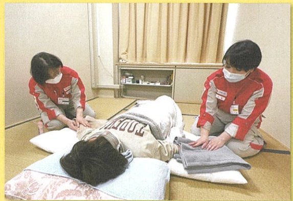
リラクゼーションルームで行政職員を支援 (七尾市役所)

水戸赤十字病院・古河赤十字病院から、医師・看護師等を珠洲市と輪島市に派遣。避難所の巡回診療・臨時救護所(珠洲市)での診療にあたりました。