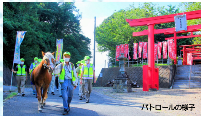
パトロールの様子

A：そうですね。高松地区内でも見知らぬ人物が他人の敷地内を覗きながら歩いていたり、盗難事件も時々発生しています。そういった不審者が嫌がることは、顔を見られることや声をかけられることだと聞いたことがあり、地域の目が多いほど不審者は寄り付きにくくなるそうです。他の地区でも活動していただければ、高松地区内での防犯力が高まります。回数が少なくても構いませんし、できる範囲で構いませんので、それぞれの地区内をパトロールしていただければと思います。