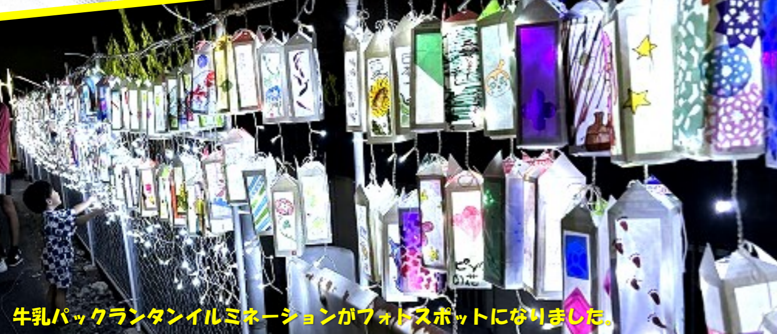
牛乳パックランタンイルミネーションがフォトスポットになりました。

令和6年7月27日(土) 高松夏まつりが開催されました。 会場を埋め尽くさんばかりの来場者が訪れ、様々なイベントが催されました。盆踊りの曲目には、ダンスヒーローが追加され、子どもから大人まで踊ることが出来、大変盛り上がりました。また、暗くなるにつれ、子ども達が作成した牛乳パックランタンのイルミネーションが会場を照らしました。