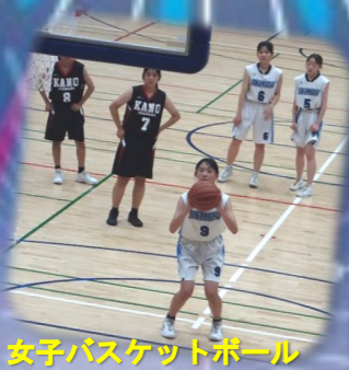
女子バスケットボール