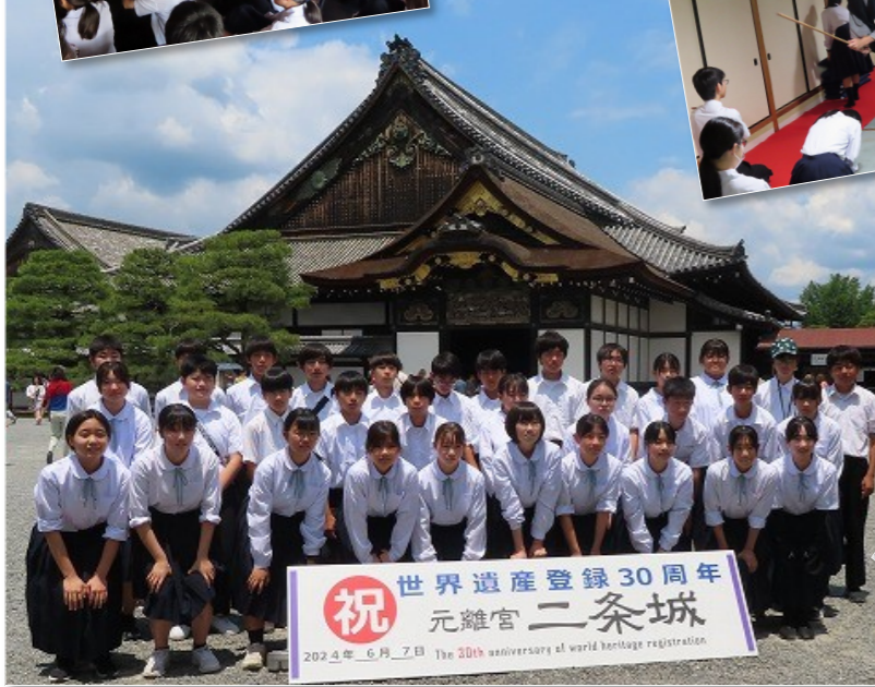
祝 世界遺産登録30周年 元離宮 二条城 2024年 6月 7日 The 30th anniversary of world heritage registration