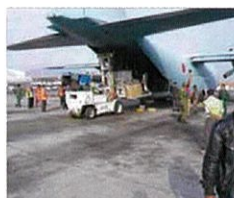
国際平和協力活動