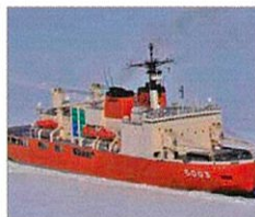
南極地域観測協力