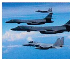
日米同盟の抑止力・対処力の強化