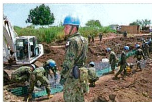
国際平和協力活動