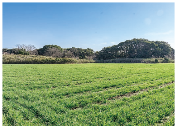
▲現在の畑の様子 (2026年にできるビール用の麦)

世界のオーガニック市場は、約17兆円で欧米が約85%を占めています。人口でいうと7億人規模です。日本でのオーガニック市場は1%のみに留まっています。私が自然栽培を始めた2008年は、日本でオーガニックの畑は全体の0.2%