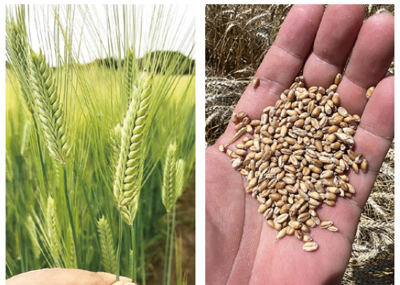
▲4月の麦の成長具合と5月末に収穫した麦

麦を自然栽培で種から育ててビールができるまでは、2年ほど時間がかかります。今、畑で育てている麦は2026年のビール用の麦です。麦は11月に種をまき、翌年の5月末に収穫を行います。収