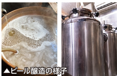
▲ビール醸造の様子

私の最終的な目標は、「おいしくて、心地良くて、身体にも良くて、地球にも良し」という