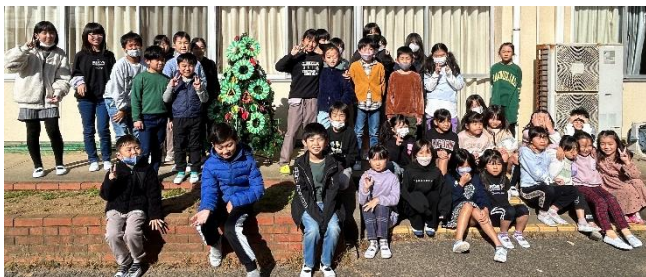
37名でクリスマスツリーを完成させました★