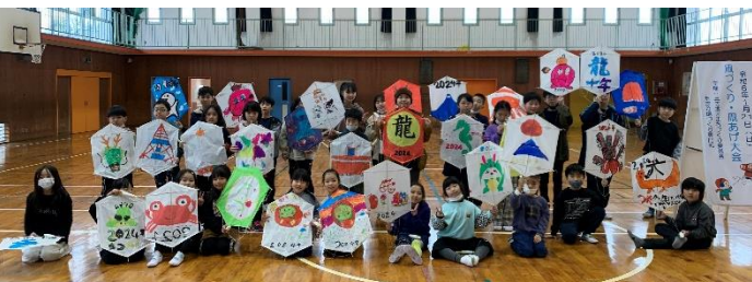
たこ・たこ・あがれ～♪30名参加