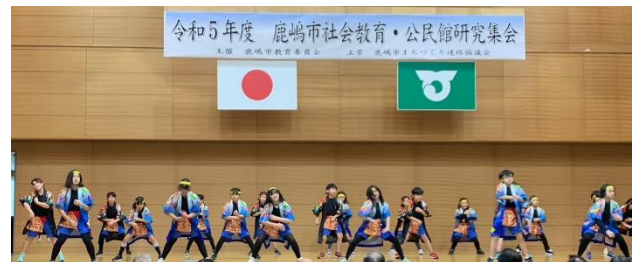
鹿嶋市社会教育・公民館研究集会にて披露☆