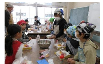
毎年大人気！！84名が参加しました！