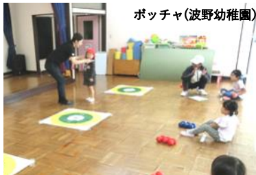
ポッチャ(波野幼稚園)

幼児にさまざまな運動を体験してもらおうと、試行的に市立の幼稚園および認定こども園に鹿嶋市スポーツ推進委員を派遣しています。