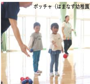
ポッチャ(はまなす幼稚園)