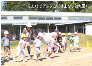
みんなでダッシュ(はまなす幼稚園)