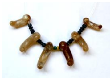
まがたま メノウ製勾玉とガラス製丸玉 桜山古墳（木滝）出土

桜山古墳の石棺からは埋葬された人が身につけていた装身具が見つかっています。勾玉（まがたま）は長さ2.8〜4.05cm、ガラス玉は4.6mm〜6.0mmと、とても小さいものです。首飾りとして使用されていたと考えられています。