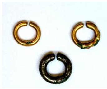
みみわ メッキの耳環 大塚古墳（宮中野）出

宮中野古墳群の大塚古墳からは、銅芯に金メッキ・銀メッキの施された耳環（みみわ）が出土しています。メッキは鍍金（めっき・ときん）とも言い、金属や樹脂の表面に素材とは異なった種類の金属の薄い膜を形成する方法です。既に高い技術を持った金工・鍍金の専門集団が権力者の下で働いていたとみられています。