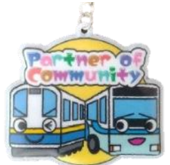
▲寄贈された反射材

地域の将来を担う子どもたちの安全を守ることを目的に、関東鉄道株式会社から9月13日（水）に反射材が寄贈されました。同社の創立100周年記念事業の一環として実施されています。