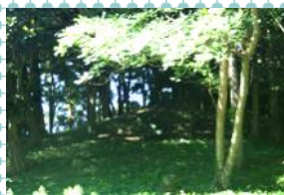
▲夫婦塚古墳（後円部・南側から撮影）