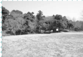
▲夫婦塚古墳遠景（南西側から撮影）

「ちゃぐりん」は、食農教育や地産地消への取り組み、農作物の育て方を学べる内容となっており、市内小学校で食育に活用されます。