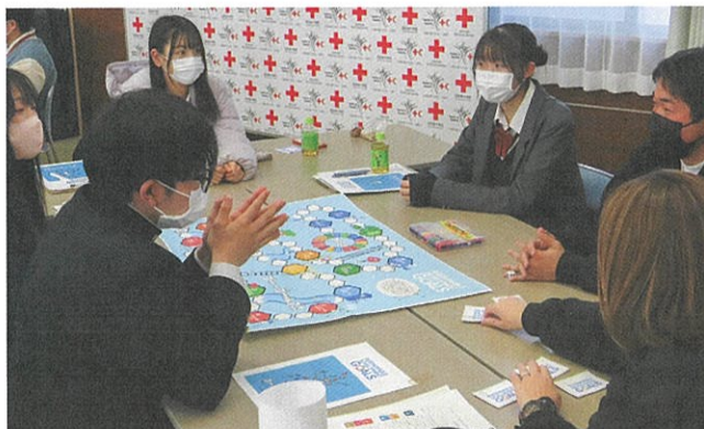
▲SDGsについて学ぶ高校生メンバー

本県では、350校、約66,000人のメンバーが、校内外での清掃活動、慰問、募金活動等の活動を通して、赤十字の心を育んでいます。