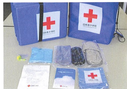
▲避難所生活に必要な救援物資(マット等)