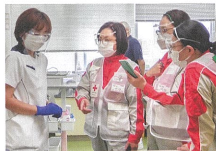
▲医療支援を行う日赤職員