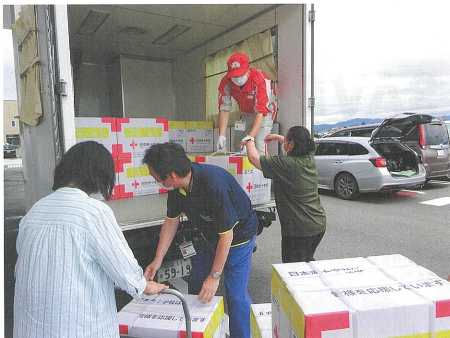
▲【令和4年8月大雨災害】救援物資を被災地に届ける日赤職員