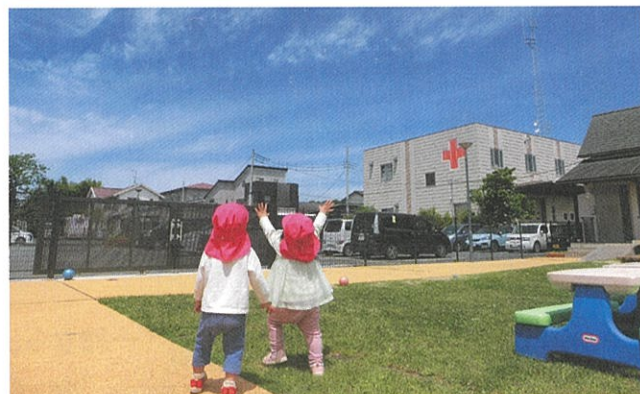
▲しゃぼん玉を追いかける乳幼児

また、乳児院では、子どもたちと一緒に遊び、授乳や離乳食を介助するボランティアが活躍しています。