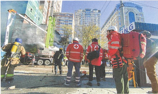
▲首都キーウで攻撃のなか、24時間体制で対応する緊急対応チーム

日本赤十字社は、資金援助に加え、ウクライナや周辺国に職員を派遣し、現地のニーズに対応した支援活動を展開しています。