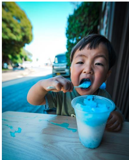
タイトル: 「夏のかき氷」