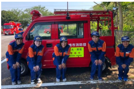
△女性消防団員の皆さんと(右から2番目)

令和4年11月に徳島県で行われた全国女性消防団員活性化大会に参加してきました。コロナの影響で3年振りの開催となり、私自身も2度目の参加でしたが、「まだまだ歴史の浅い鹿嶋市女性消防団がより発展していくために、他の団体がどんな活動をしているのか知りたい」との思いで、鹿行代表として出席しました。展示会では、団員が作成した、災害が起きたときに落ち着いて行動するためのカードや、百円ショップなどでも揃えられる防災グッズが紹介されていて、「私たちにできることはまだまだたくさんある！」と刺激を受けました。