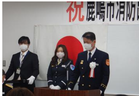
令和5年1月7日 鹿嶋市消防団出初式で

防災に関する啓発などが主な活動になります。女性消防団も訓練をしたり、火事の際に現場で消火活動を行うと思われがちですが、実際はAEDの使い方を指導したり、イベントで広報活動をする役割を担っています。