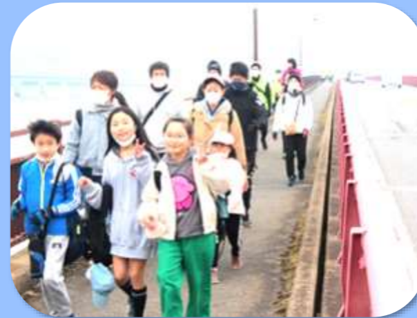
▶ まだまだ余裕♪♪ いい笑顔♪♪♪