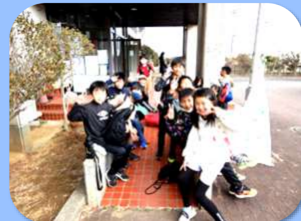
▶ 潮来の大生原公民館で休憩。もっ少しで昼食だ!