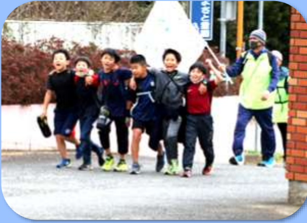
▶ 一番でゴール! 僕たち、もう一周行けるよ!