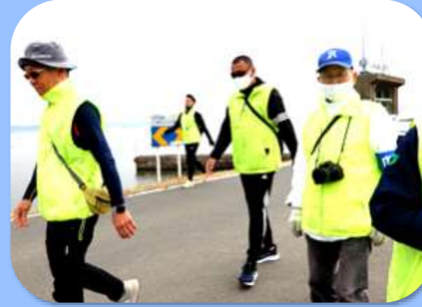
▶ 黄色いベストは役員さん。いつもありがとございます。