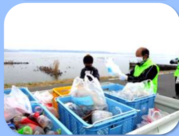
▶ 軽トラ3台にたくさんゴミが集まりました。