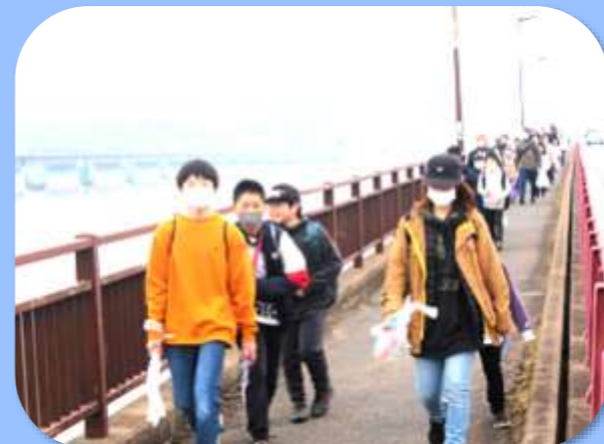
▶ 今年は暖かくて歩きやすい。完歩めざして頑張るぞー!

令和5年2月19日(日)第39回北浦一周歩く会を実施しました。この事業は、北浦湖岸をゴミを拾いながら歩くことを通して、自分たちの住む地域の自然の豊かさを感じ環境美化に関心を持ってもらうこと、親子や参加者同士のふれあいを深めることを目的としています。今年度は3年ぶりに、従来の33kmを97人の参加者で歩くことができました。白浜少年自然の家でみんなで食べたお弁当、盛り上がった抽選会、そしてゴールをした時の達成感忘れられない思い出になったことと思います。参加者のみなさん、お疲れ様でした!