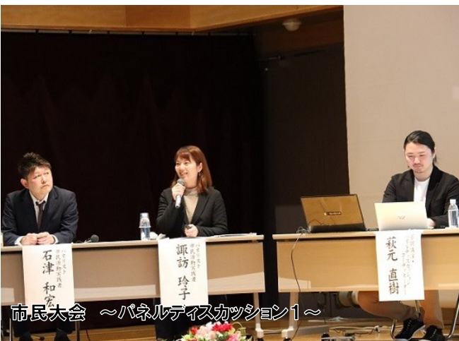
市民大会 ～パネルディスカッション1～