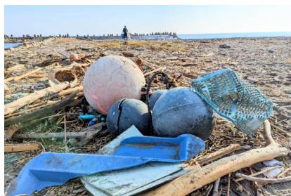
▲清水地区の海岸に漂着したゴミ