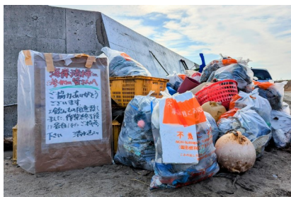
▲たくさんのゴミが回収できました！