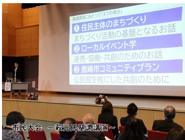
市民大会 ～萩元氏基調講演～