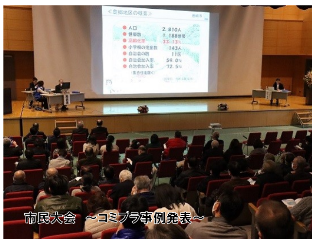
市民大会 ～コムブラ事例発表～