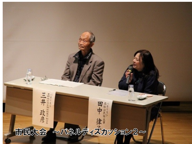
市民大会 ～パネルディスカッション2～