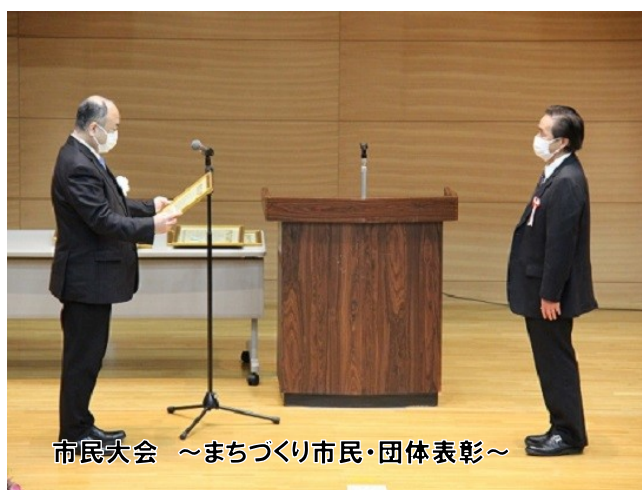
市民大会 ～まちづくり市民・団体表彰～