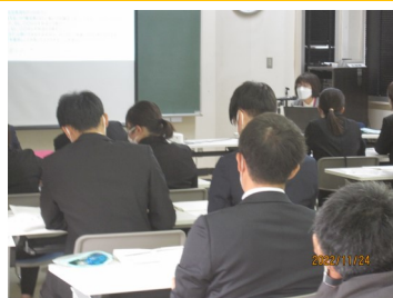
▲教職員研修の様子