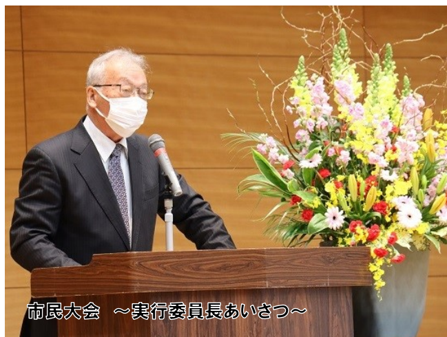
市民大会 ～実行委員長あいさつ～