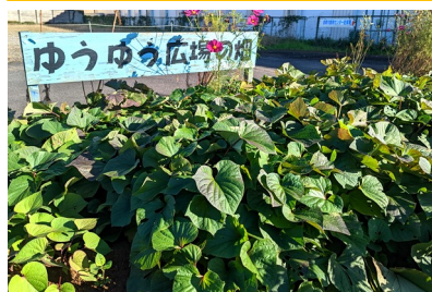
▲通所している子どもたちの畑