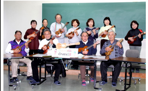
▲日頃の活動の様子

平均年齢は70歳を超える高齢集団で、脳トレと仲間づくりを目的にウクレレの練習に励んでいます。