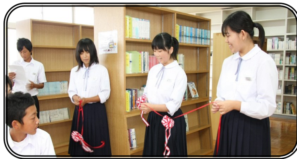
▲開館セレモニーの様子

今後は、図書委員会を中心に生徒自身が「どうしたらみんながもっと本を読むようになるか」などをテーマに様々な企画・取組みを行い、よりよい図書館になることをめざしていきます。