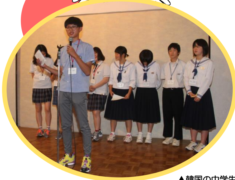
▲韓国の中学生が日本語で自己紹介