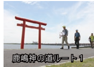
鹿嶋神の道ルート1

問 鹿嶋人ギャラリー内「鹿嶋神の道運営事務局」 77-8878 (10:00～16:00、木曜日定休)