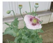
アツミゲシ (セティゲルム種)

近くでこんな花を見かけたことはありませんか。法律による栽培・所持などの禁止を知らずに不正に栽培していることがあります。疑わしい花を見つけた場合は、下記にご連絡ください。