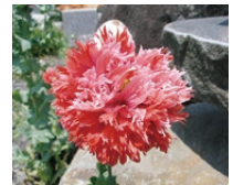
ケシ (ソムニフェルム種)