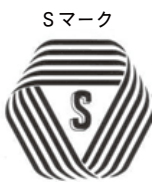
厚生労働大臣認可